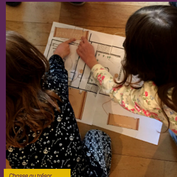
Chasse au trésor.

maquette : service communication - janvier 2018