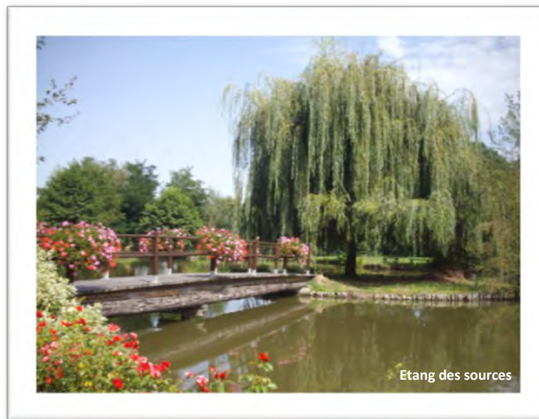
Etang des sources

Un secteur santé de tout premier ordre (Médecins, dentistes, kiné, infirmières, pharmaciens, opticien).