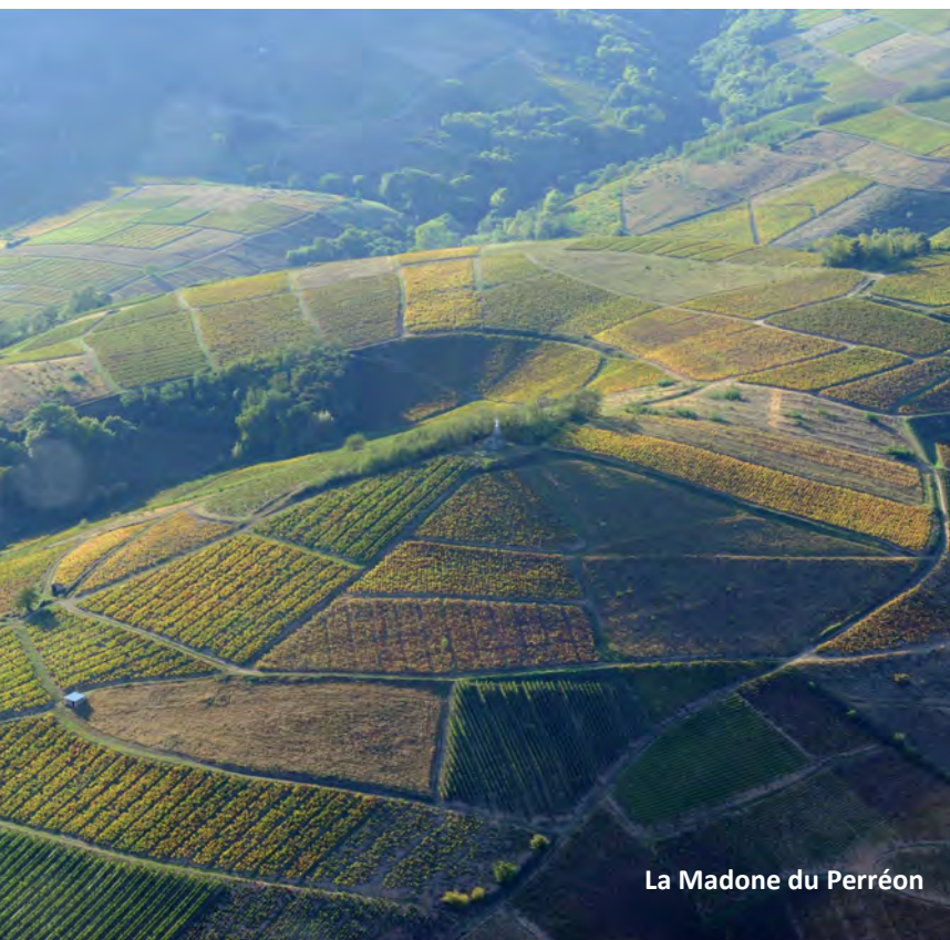
La Madone du Perréon