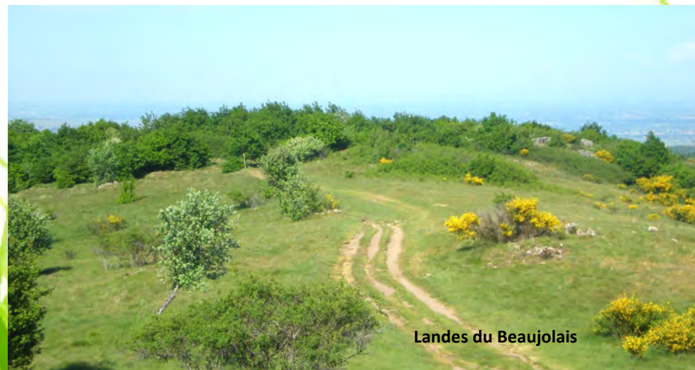
Landes du Beaujolais