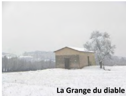
La Grange du diable

RETOUR 45 mn environ : Empruntez le chemin bordé de saules (perpendiculaire à la Saône) sur 400m environ jusqu'au pont de la Pucelle, puis par la route goudronnée, longez le château, la ferme et le haras de Boistray. Retour à votre