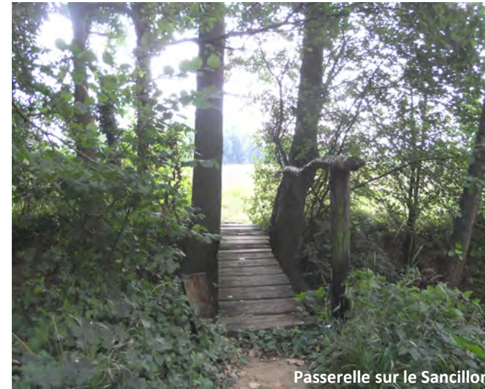
Passerelle sur le Sancillon