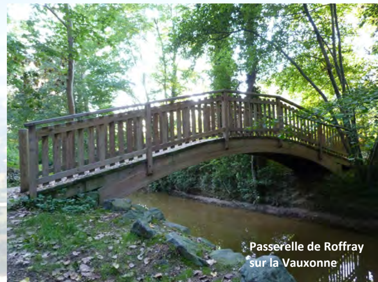
Passerelle de Roffray sur la Vauxonne