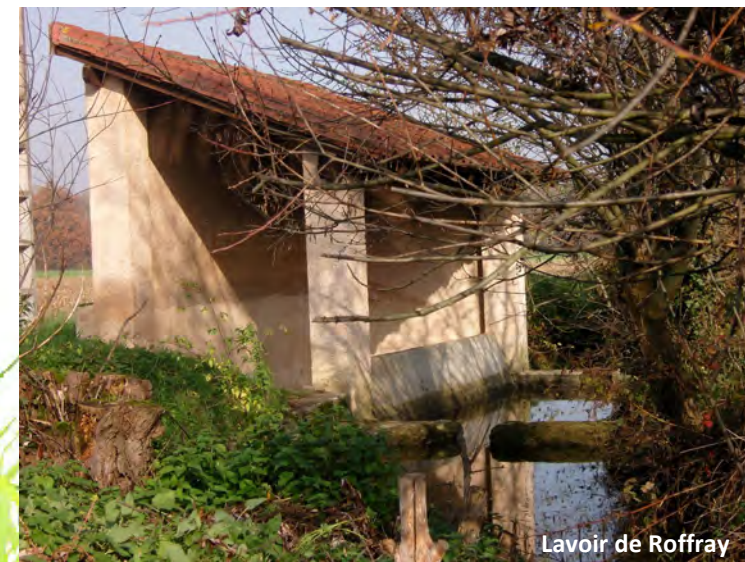
Lavoir de Roffray

De nombreuses échappatoires vous permettent de raccourcir votre parcours.