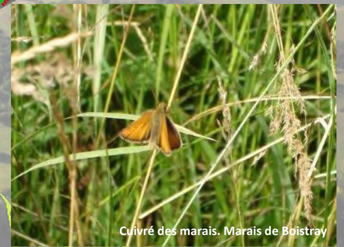
Cuivré des marais. Marais de Boistray